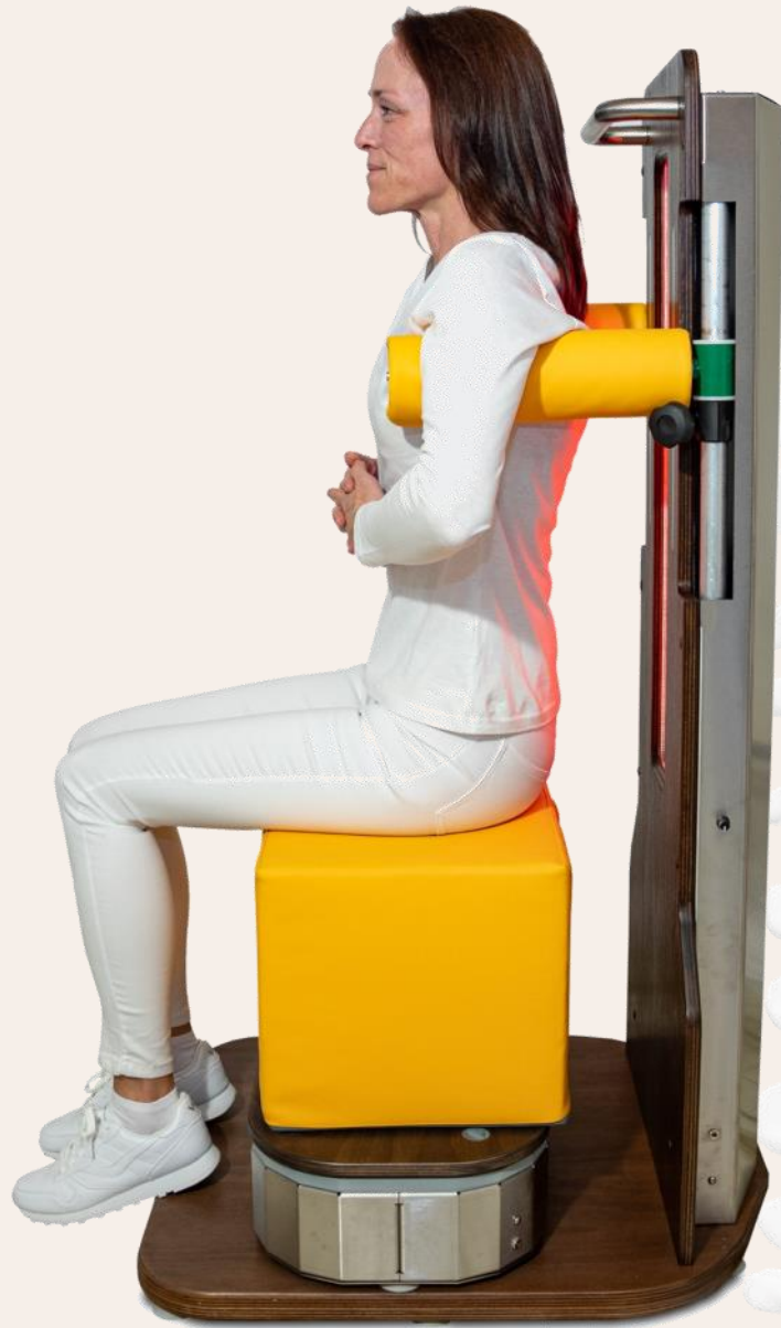
Rückenstrecken gemeinsam mit Frequenztraining und Infrarot